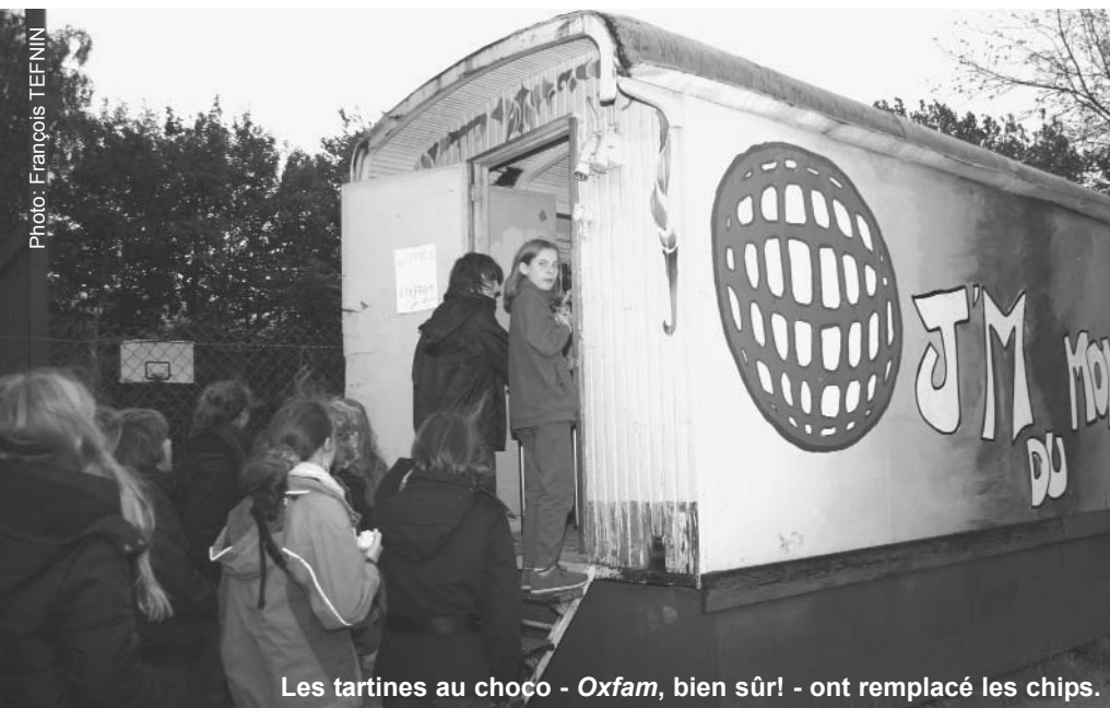
Les tartines au choco - Oxfam, bien sûr! - ont remplacé les chips.

Résister à l'école peut prendre des formes très diverses. Comme le fait d'opter pour un distributeur Oxfam plutôt que pour un classique distributeur de coca. Mais cela a aussi un prix.