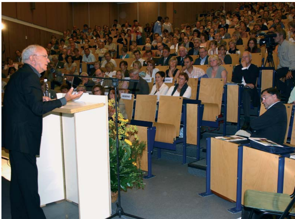
Pourquoi les parents d'aujourd'hui ont-ils tant de mal à exercer ce mécanisme de frustration élémentaire?

Loin d'être, de son propre aveu, un spécialiste de la chose scolaire, A. NAOURI a tout de même un avis sur les missions de l'école et ses relations avec les familles. Aujourd'hui, constate-t-il, il existe une faille gigantesque dans la communication entre enseignants et élèves. Sur les bulletins, on continue à trouver des mentions comme "Ne travaille pas", "Ne fait pas assez d'efforts", etc. Mais cela n'a aucun écho chez les élèves. Ils y sont absolument sourds! L'effort? Le travail? C'est quoi? Comment pourraient-ils accepter l'idée qu'il y a un minimum d'énergie à fournir pour obtenir un résultat, quand ils ont emmagasiné tant de bénéfices dans la plus grande passivité et qu'on leur a toujours laissé penser que tout leur était dû? Dans ces conditions, se voir reprocher un mauvais bulletin et s'entendre dire qu'il faut fournir des efforts fait naître chez eux une terrible