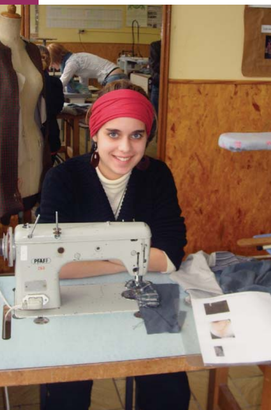
Faire du neuf avec du vieux, pour la bonne cause.

Il s'en passe des choses dans et autour des écoles: coup de projecteur sur quelques projets, réalisations ou propositions à mettre en œuvre. Poussez la porte!