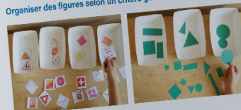
Réalisation d'un classement sans critère donné.

Organiser des figures selon un critère géométrique + Les termes utilisés pour désigner les figures