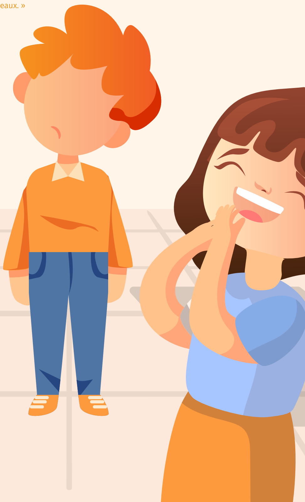
Illustration : Manon MOREAU

Jean-Louis FOURNIER , Où on va, papa ? Le Livre de Poche