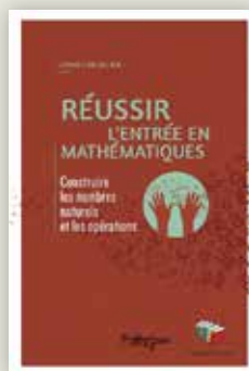
..... Anne CHEVALIER Réussir l'entrée en mathématiques, construire les nombres naturels et les opérations Changements pour l'Égalité asbl Éditions Couleur livres, 2020