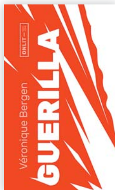
Véronique BERGEN Guérilla ONLIT-Éditions, 2019

Les guerres provoquées par la débâcle écologique ont dévasté la Terre. Une galerie de personnages se relèvent pourtant : un écoguerrier, une femme-chamane ou encore un enfant muet. Entre vagues d'insurrection, effondrement mondialisé et nouvelles alliances avec la nature, Guérilla , écothriller d'un genre nouveau, se déploie au milieu des explosions de grenades pour entonner un vibrant appel en faveur de notre planète.