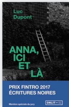
Luc DUPONT Anna, ici et là ONLIT-Éditions, 2018

Auxiliaire de police fraîchement nommée en milieu rural, Anna rencontre Matilda au milieu des vieilles pierres et des pieds de vignes. Riche propriétaire, Matilda gère un domaine qui attise les passions et suscite la convoitise. Peu à peu, un drame se noue sous nos yeux, dans une atmosphère crépusculaire qui n'est pas sans évoquer celle des meilleurs romans policiers scandinaves.