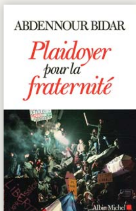
Abdennour BIDAR Plaidoyer pour la fraternité Albin Michel, 2015

La thèse qu'A. BIDAR souhaite développer est que seule la fraternité laïque peut rassembler tant les croyants que les agnostiques ou les athées autour d'un horizon commun intellectuel ou moral. Pour étayer celle-ci, il rédige dix propositions pour une France fraternelle, dont certaines semblent quelque peu utopiques. N'est-ce pas, cependant, une façon pour la philosophie de nous donner accès à une compréhension de « l'intérieur » de l'homme ? Fabrice GLOGOWSKI