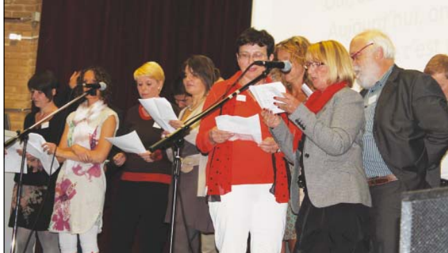
L'équipe du SeDEF de Tournai donne de la voix...

1. Fédération de l'Enseignement fondamental catholique