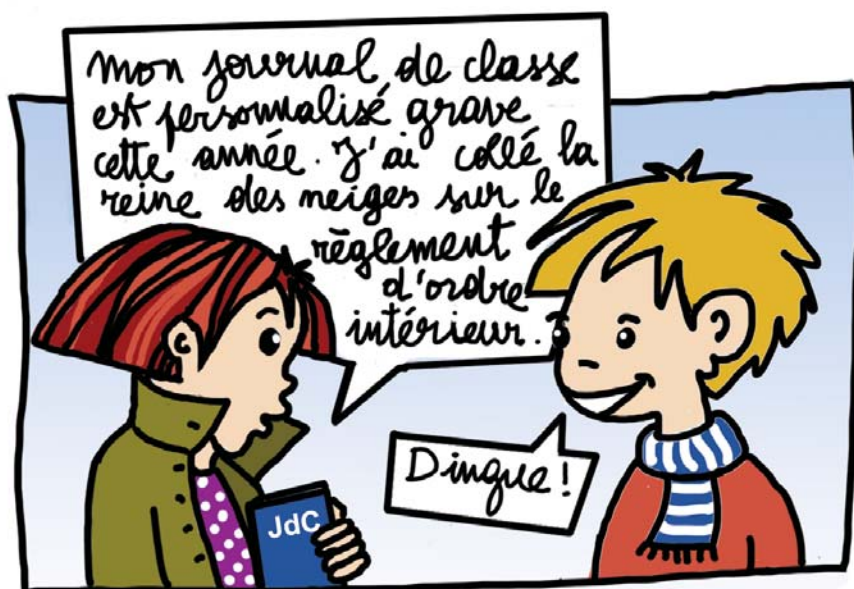
Illustration : Anne HOOGSTOEL

Les commandes peuvent se faire par téléphone ou via le site www.monjdc.be (voir informations pratiques ci-contre)