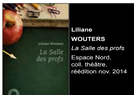
Liliane WOUTERS La Salle des profs Espace Nord, coll. théâtre, réédition nov. 2014