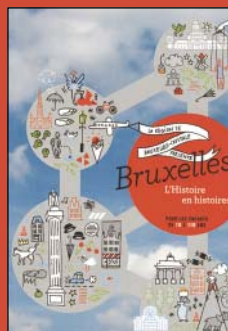
Bruxelles, l'Histoire en histoires Pour les enfants de 10 à 110 ans Région de Bruxelles-Capitale, 2014

Chaque école de la Région bruxelloise a reçu un exemplaire de cet ouvrage. Pour obtenir un/des exemplaire(s) supplémentaire(s), veuillez envoyer un mail à bvanderbrugghen@sprb.irisnet.be (Direction des Monuments et sites du Service public régional de Bruxelles)