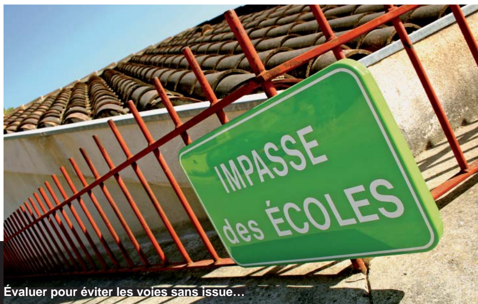
Évaluer pour éviter les voies sans issue...