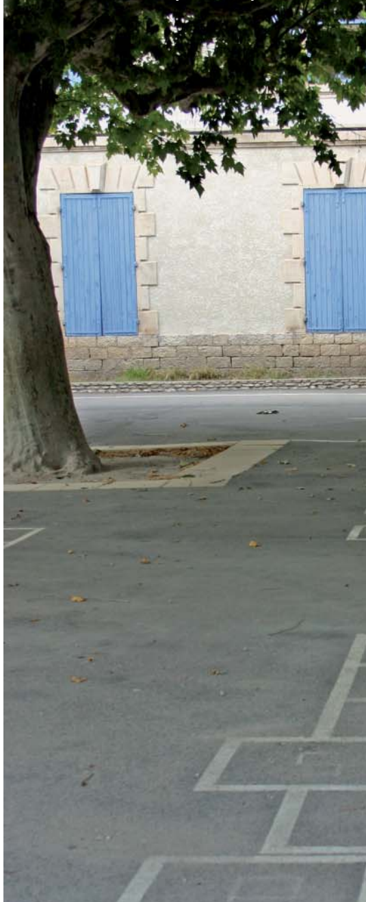
IMAGE DE L'ÉCOLE ET IMAGE DE SOI...

Comment accéder au "ciel" de la bonne école? Bonne pour chaque élève...